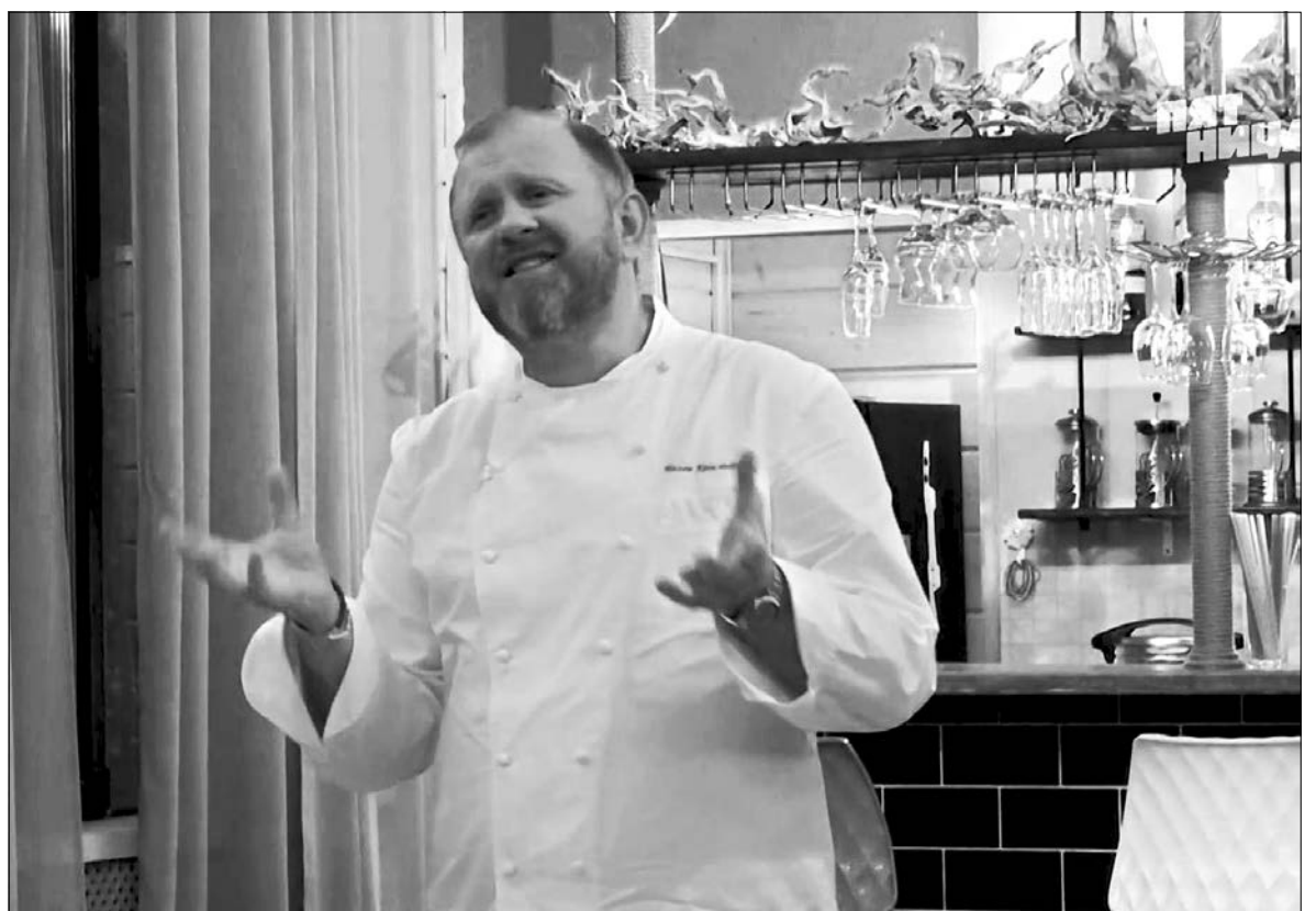
Фото: кадр из выпуска шоу «На ножжах» в Калязине.

Выпуски шоу «На ножжах» в Кашине и Калязине можно посмотреть на сайте телеканала «Пятница».